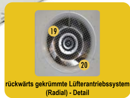
rückwärts gekrümmte Lüfterantriebssystem (Radial) - Detail