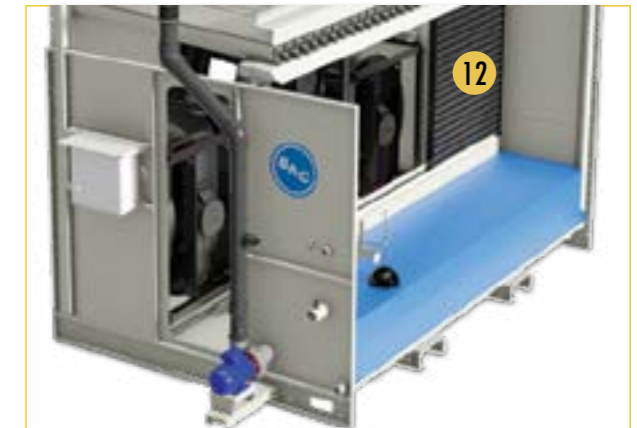
i Nur für Modelle der vorherigen Generation PLC 12. Lufteintritts-Schutzelemente