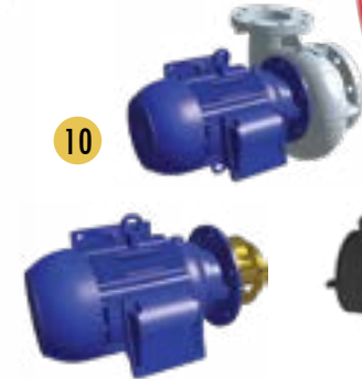
Sproeipomp zonder slakkenhuis